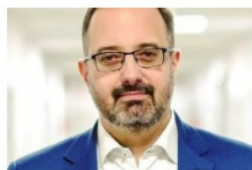
Łukasz Konarski prezydent Zawiercia