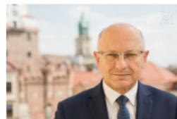
Krzysztof Żuk prezydent Lublina