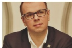
Wojciech Bakun prezydent Przemysła