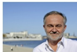
Wojciech Szczurek prezydent Gdyni

- Bardzo miłe informacje w niedzielny wieczór. Zostałem nominowany do