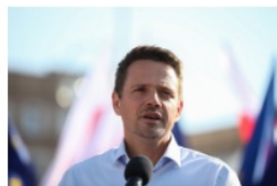
Rafał Trzaskowski prezydent Warszawy