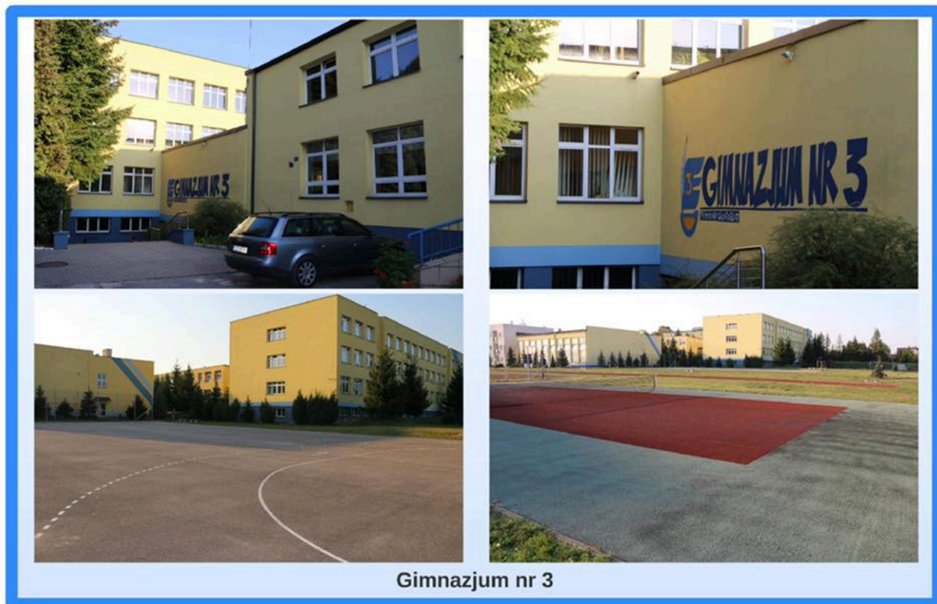
Gimnazjum nr 3