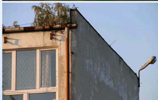
Zespół Szkół Zawodowych nr 3