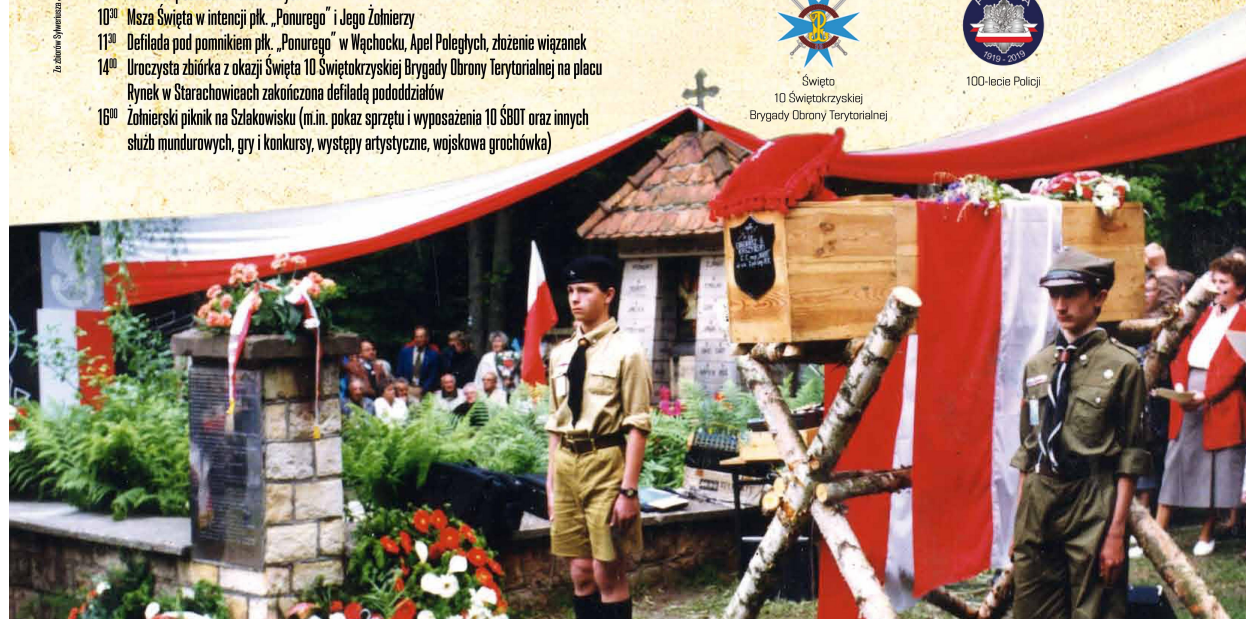
Wspieracie organizacyjnie i finansowo w organizacji uroczystości