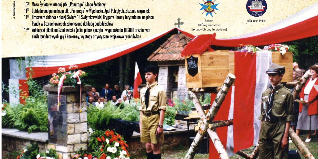
Wspierca organizacyjna i finansowa w organizacji uroczystości