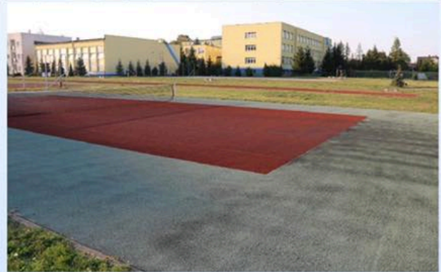
Gimnazjum nr 3