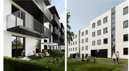
Zespół budynków mieszkalnych