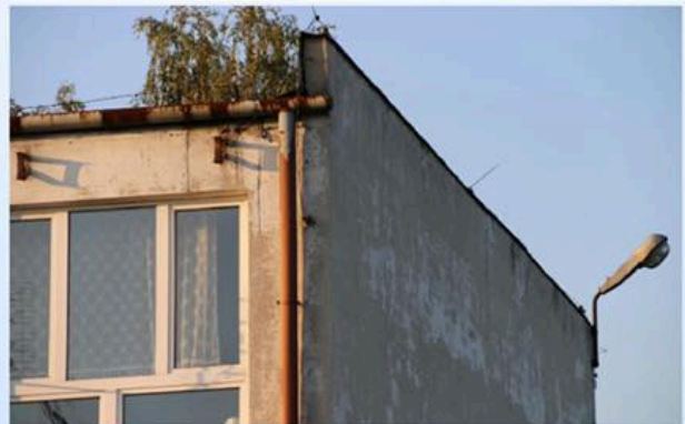
Zespół Szkół Zawodowych nr 3