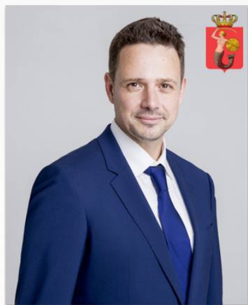
Rafał Trzaskowski Warszawa

Popularność prezydentów polskich miast w mediach społecznościowych na tle liczby mieszkańców miasta, którym zarządzają