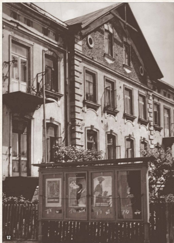
Kamienica czynszowa Giepardów przy ulicy Kolejowej 17. Był to najbardziej reprezentacyjny gmach w dawnym Wierzbniku, wyróżniający się wielkością i ozdobną elewacją fasady. W latach I wojny światowej mieściła się tu siedziba okupacyjnych władz austro-węgierskich. Na pierwszym planie znajduje się gablota z plakatami filmowymi kina, które znajdowało się na lewo od kamienicy; fotografia z połowy lat 50. XX w.