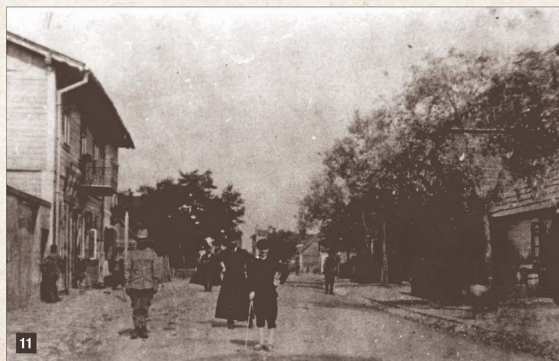
Zabudowa ulicy Starachowickiej (obecnie Piłsudskiego) w latach I wojny światowej